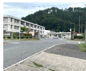
駐車スペースから 白鷹中学校正門